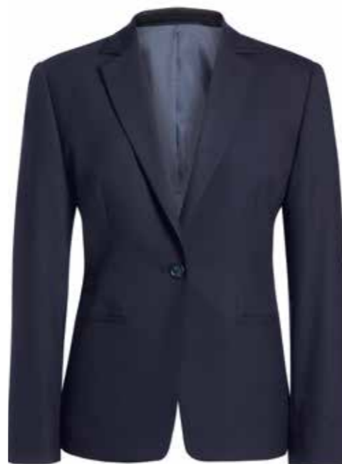
Centro Dietro taglia 44=63 cm