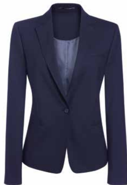
Centro Dietro taglia 44=55 cm