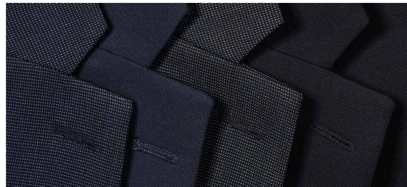
A. Blu microfancy